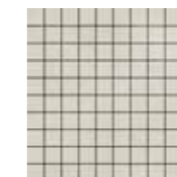
4100534 GRID BLACK