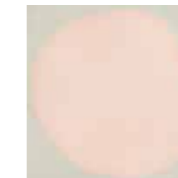
4100528 DROP ROSE