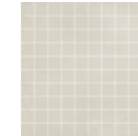
4100524 GRID WHITE