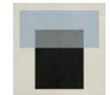
4100539 T BLUE