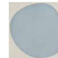
4100537 DROP BLUE