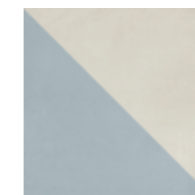
4100536 HALF BLUE