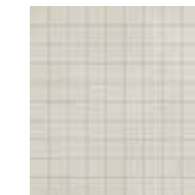
4100538 GRID BLUE