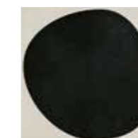
4100533 DROP BLACK