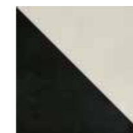
4100532 HALF BLACK