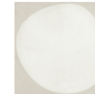
4100523 DROP WHITE