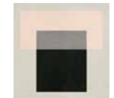
4100530 T ROSE