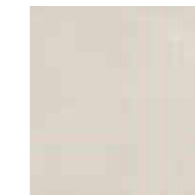
4100529 GRID ROSE