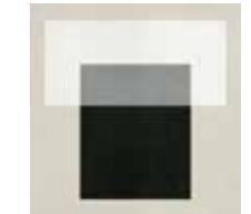
4100525 T WHITE